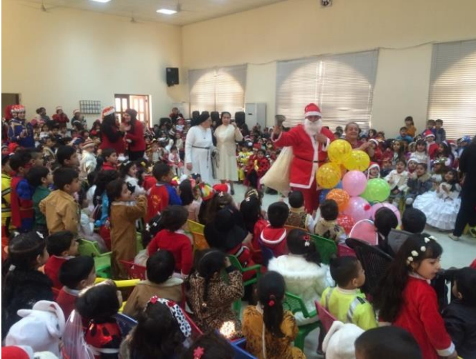
لروضة الراهبات صفحة في الفيسبوك بعنوان: حضانة وروضة القديس يوسف لراهبات التقدمية في البصرة