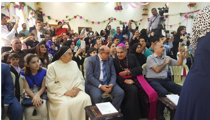
St. Joseph Nursery School where 500 of Basra's children are taught