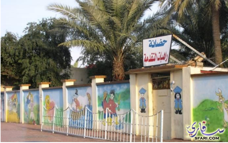
الحضانة والروضة من جهة شارع 14 تموز