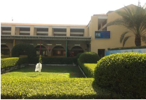
بناية روضة مار يوسف التي يتعلم فيها اكثر من 500 طفل سنويا

شاركت راهبات التقدمة الدومنيكيات في خدمة البشارة في العمارة والبصرة. ففي البصرة والعمارة افتتحت رسالتهم عام 1906 و1907 على التوالي. قامت الرهبنة في العمارة بإنشاء مدرسة ابتدائية للبنات ومستوصف. ولكن في سنة 1914 توقفت الرسالة في المدينة بسبب اندلاع الحرب العالمية الأولى. وفي الموقع قبر راهبتين توفيتا بسبب مرض الكوليرا وقد اندثرت آثار عمل الراهبات والرهبان وتم بيع املاك كثيرة كانت تملكها 1 .