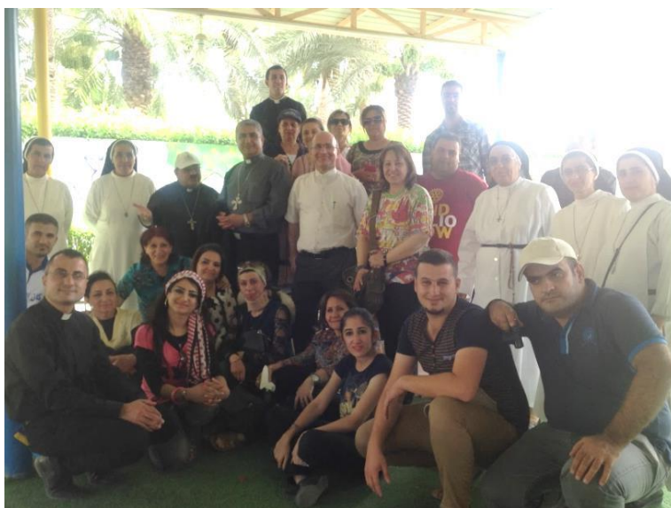
زيارة وفد كوادر التعليم المسيحي في بغداد 2014